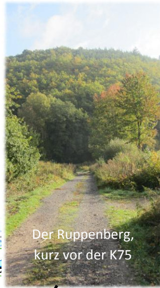
Der Ruppenberg, kurz vor der K75