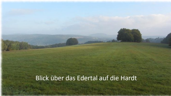
Blick über das Edertal auf die Hardt