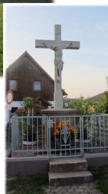
Das Dorfkreuz in Rothhelmshausen