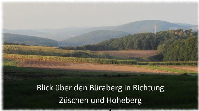
Blick über den Bürberg in Richtung Züschen und Hoheberg