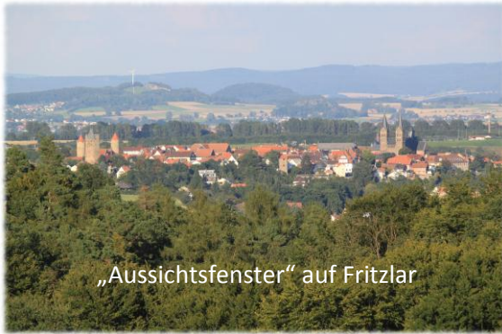
„Aussichtsfenster“ auf Fritzlar