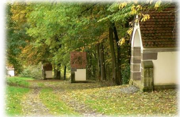
Kreuzwegstation zum Büraberg