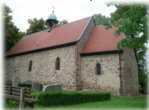
St. Brigida Kapelle